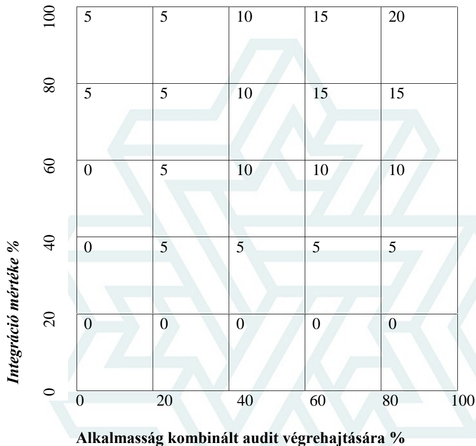
1 sz. ábra

1 sz. ábra: A kombinált audit időtartamának lehetséges csökkentését ábrázolja %-ban, a következők függvényében: